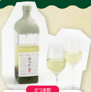
さつま町 柳田製茶 紫尾山麓若蒸煎茶 上煎茶 80g 1,300円