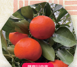
薩摩川内市 むらかみファーム みかん 1袋(5個入) 500円