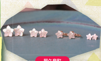
屋久島町 SHIM SHAM JEWELRY ブルメリアピアス 1組 6,000円