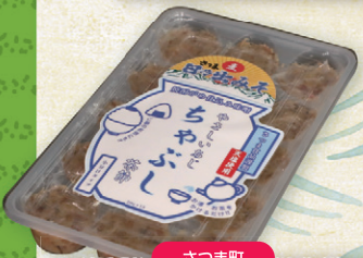
さつま町 さつま食品 さつま日乃出みその 茶節 300g 1,000円