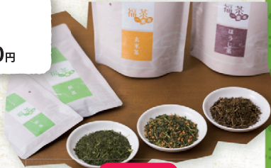
志布志市 まる正福茶園 福茶深蒸し一番茶 45g 500円