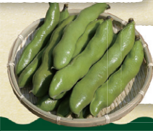
JA県経済連 JA鹿児島県経済連 そらまめ お楽しみ!!

2024年 12 / 12 10:00~19:00 (木) 13 10:00~19:00 (金)