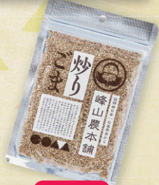
喜界町 峰山農本舗 喜界島産炒りごま 40g 800円