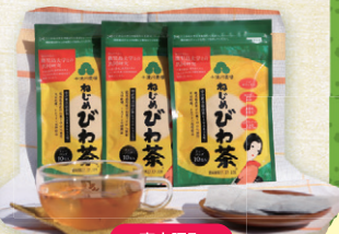
南大隅町 十津川農場 ねじめびわ茶 60g 1,200円