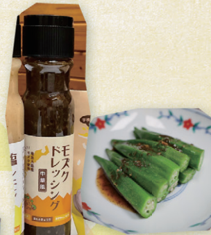
宇検村 smewfarm モズドレッシング 230g 650円