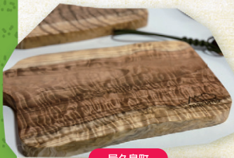
屋久島町 mokumo Yakushima 2way カッティングボード 1個 8,000円~