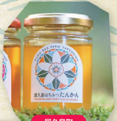
屋久島町 久保養蜂園 屋久島ファーム 屋久島はちみつ たんかん 120g 3,800円