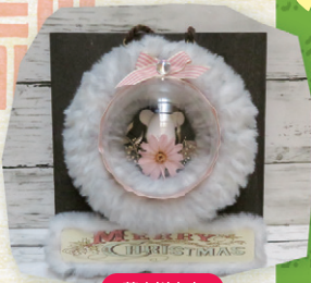
薩摩川内市 パーフェクト工房 モコモコリース 1個 2,000円