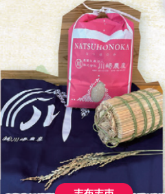
志布志市 (株)川崎農産 なつほのか(お米) 5kg 3,510円