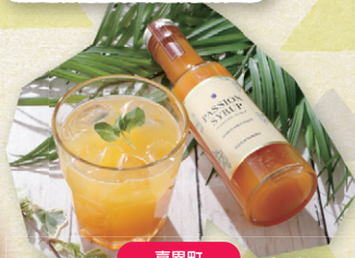
喜界町 SONTAR GARDEN パッションシロップ 240g 2,200円