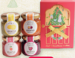
瀬戸内町 かけろまの森 クリスマスボックス入り ミニジャム4本セット 50g×4本 2,200円