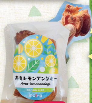
瀬戸内町 irOrO あまレモンアンダギー 6個 600円