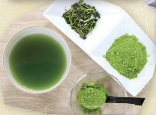
南大隅町 一加 佐多モリンガパウダー 25g 1,080円