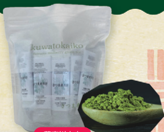
薩摩川内市 (株)バイオアース さつま桑青汁 30個入 3,500円